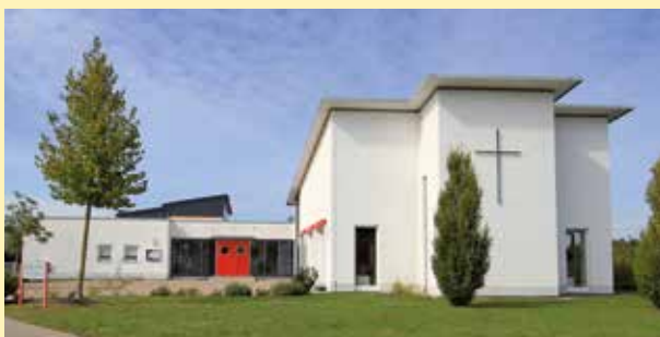
Gemeindezentrum Philipp-Melanchthon-Haus Jettingen-Schepfach