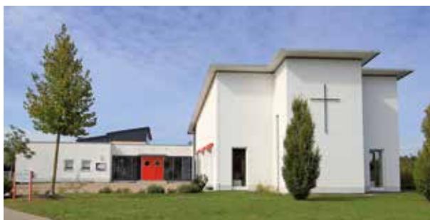
Gemeindezentrum Philipp-Melanchthon-Haus Jettingen-Schepfach